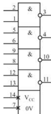
Таблица назначения выводов